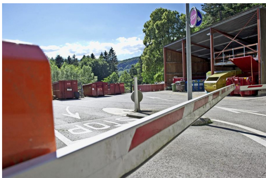
La déchetterie de la commune de Bassins affiche un déficit de 120'000 francs.

Finances publiques La commune boucle sur un déficit de 600'000 francs. L'exercice 2014 est jugé catastrophique par la Municipalité.